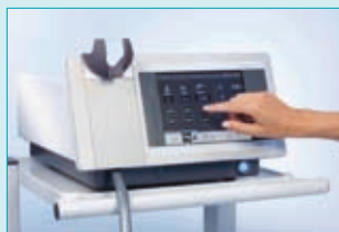
Dornier MedTech ARIES

Ausbildung - Produkte - Information TRIGGOsan - GmbH Eppendorfer Landstr 148, 20251 Hamburg Tel.: 040-485125 Fax: 040-484365 www.triggosan.eu info@triggosan.eu